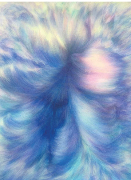
「Angel wings」カンバスにアクリル H100 X W81cm 2020年