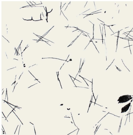
「風の譜7-II」45×45cm ドライポイント 2021年